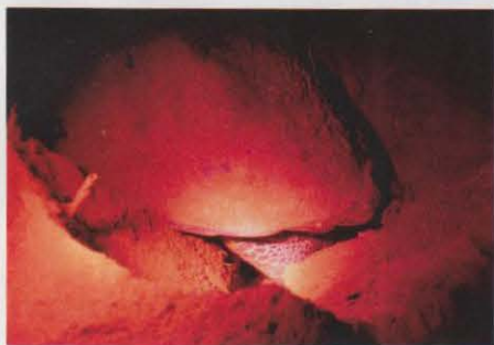
↑ Kareta obrovská při kladení vajec. Svítit je dovoleno pouze červeným světlem.