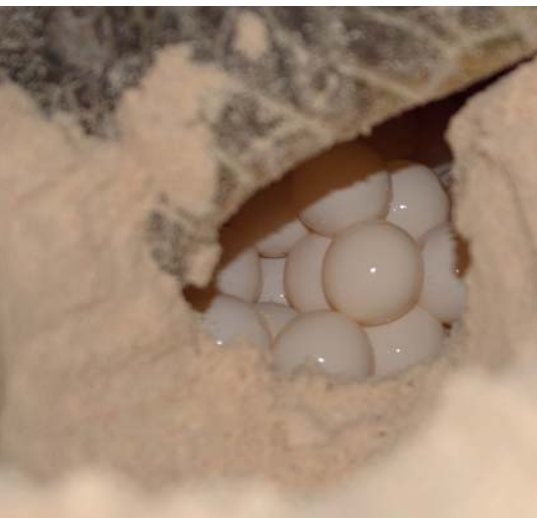
↓ Mořská želva při kladení vajec

v tuto chvíli víc v České republice. Pracuji ve Vzdělávacím centru TEREZA, po večerech dělám hodně přednášek o želvách a jejich situaci – v knihovnách, na univerzitách, ve školách. Jsem ráda, že lidé začínají program podporovat. Moc nám pomáhá, když někteří posílají 100 či 200 Kč měsíčně. Jiní lidé zase pomáhají s informováním veřejnosti. To je moc důležité, protože spousta Čechů dnes jezdí do zahraničí na dovolenou a často je to právě do míst, kde žijí mořské želvy. V tropech se pak Češi mohou setkat s nabídkou želvích vajec k jídlu či s prodejem náramků z želvoviny. Takové náramky se vyrábí tak, že se želva přibije na dřevěnou desku a dá se na hodinu či dvě nad oheň. Když má krunýř horký, vezme se nůž a želvovinové pláty se jí od kostěné vrstvy odloupnou. Napůl uvařená želva se pak hodí zpět do moře, místní věří, že se uzdraví a krunýř jí doroste, želva ale ve strašných bolestech i několik dní umírá. Tohle se děje přesto, že je to nelegální. Je pak na každém turistovi, jak se rozhodne, koupit a přispět k mizení želv nebo vyfotit a nahlásit to třeba pomocí naší aplikace Turtle ranger. Fotky se mi pošlou i s GPS lokalizací a já je pak mohu použít při komunikaci s policisty jako důkazy.