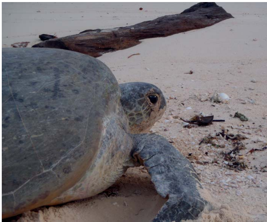
↑ Na ostrov Sangalaki přichází klást vejce i 30 karet obrovských denně

► želvy vyhynuly, tyto důležité funkce z ekosystému zmizí a moře už nikdy nebude stejné. Stala jsem se konzultantem pro místní lidi a společně jsme se snažili nastavit efektivní způsob ochrany želv. Založili jsme místní organizaci nazvanou Konservasi Biota Laut Berau (Ochrana mořského života v Berau). Je to jen 15 Indonésanů, kteří v Berau chrání 3 ostrovy před zloději želvích vajec. Obcházejí ostrov, hlídají pláž a přenášejí vejce do bezpečí. Od roku 2014 zachránili už přes 2 miliony želv, které se mohly bezpečně vylíhnout a odejít do moře. Na to jsem hrdá!