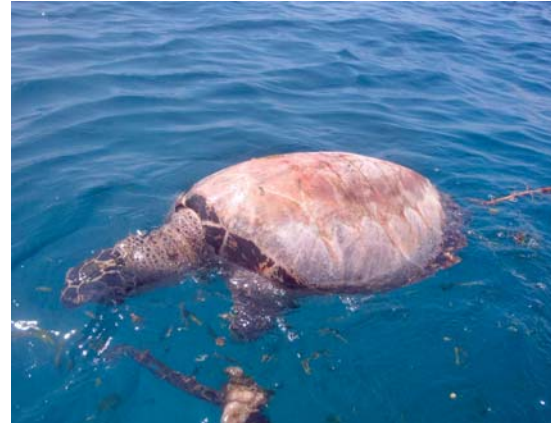
Pokles populace karet obrovských v lokalitě, kterou chráníme.

↓ Želva bez želvoviny – smrt kvůli náramkům