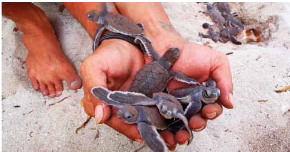
Malé mořské želvy.