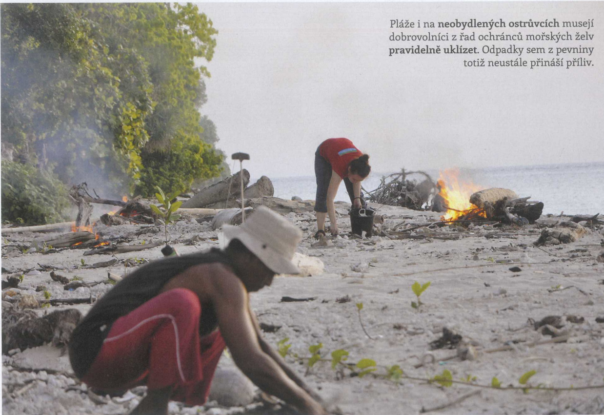
Pláže i na neobydlených ostrůvcích musejí dobrovolníci z řad ochránců mořských želv pravidelně uklízet. Odpadky sem z pevniny totiž neustále přináší příliv.