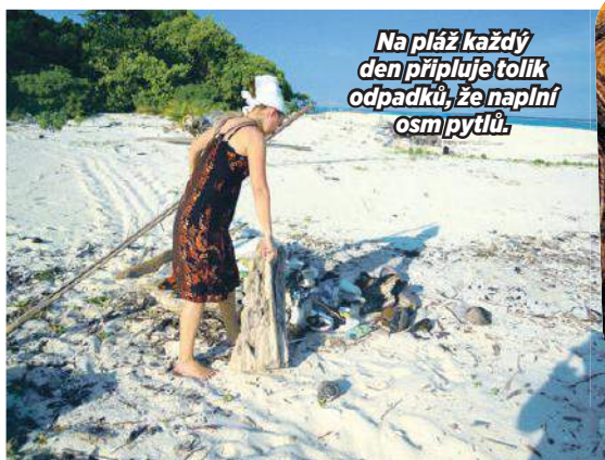
Na pláž každý den připluje tolik odpadků, že naplní osm pytlů.