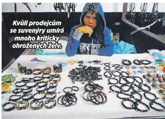
Kvůli prodejčům se suvenýry umírá mnoho kriticky ohrožených želv.

ve, listy a zloději už pak vajíčka nenajdou.