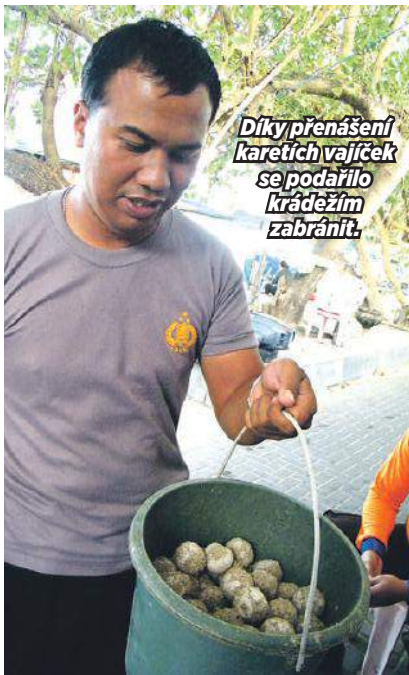
Díky přenašení karetích vajíček se podařilo krádežím zabránit.

Všechny želvy Svobodová a její pomocníci zřejmě ochránit nedokážou, ale jak se říká: „Na každého jed-