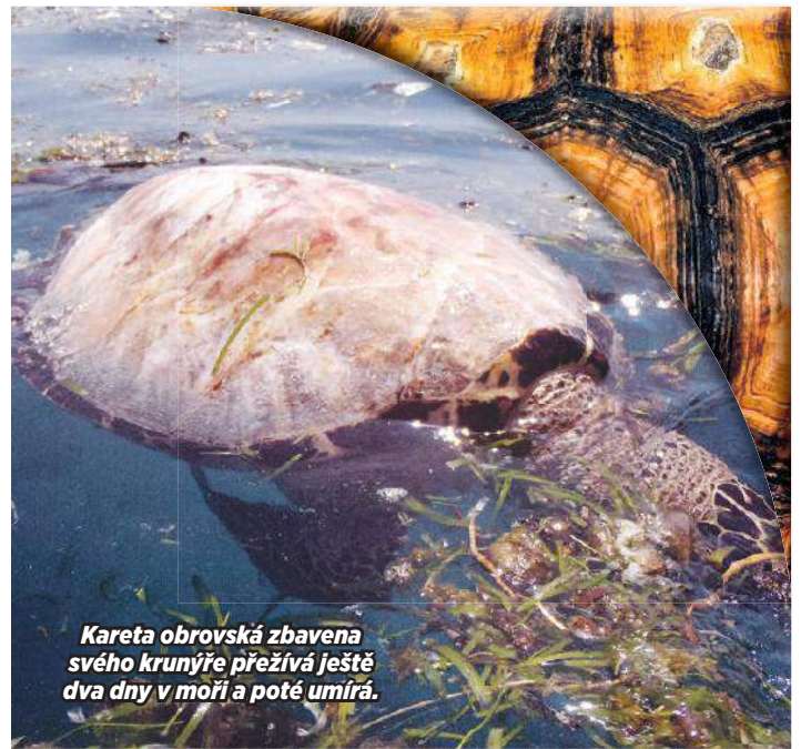
Kareta obrovská zbavena svého krunyře přežívá ještě dva dny v moři a poté umírá.

nou dojde.“ To platí i pro milovníky želvích vajíček a masa. „V roce 2013 několik lidí zemřelo, protože snědli maso nemocné želvy. Mnoho lidí požilo zkažená želví vajíčka, která jim způsobila průjmy, zvracení a několikrát,“ odrazuje případné konzumenty Svobodová.