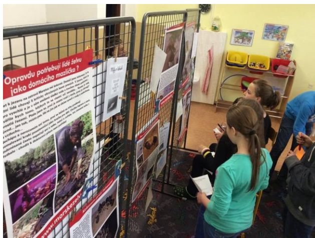
← ZŠ Janovice

Jsem si jistá, že všechny tyto akce rozšířily povědomí o problémech želv mezi velké množství dalších lidí a třeba to některé z nich inspirovalo k hledání dalších informací o želvách a k případné budoucí pomoci. Všem Vám moc děkuji, jste skvělí, Vaše pomoc podpora je pro mě velkou odměnou a motivuje mě každý den pokračovat v často ne úplně jednoduché práci v Indonésii.