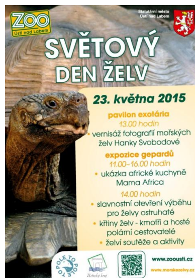
Světový den želv (23. 5. 2015) v ZOO Ústí nad Labem →