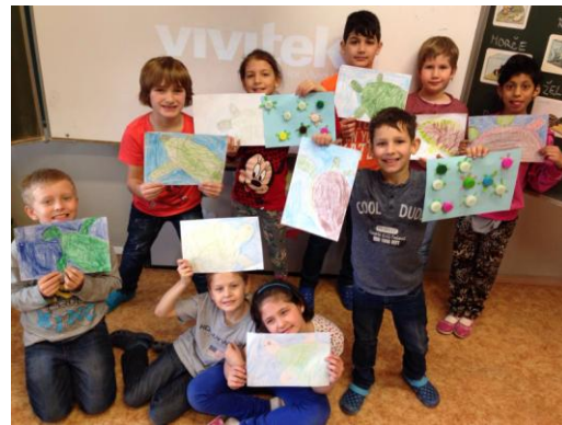
Povídání o želvách pro logopedické a neslyšící děti.

Moc Vám všem děkuji, za podporu i pomoc se šířením informací o želvách, má to smysl!