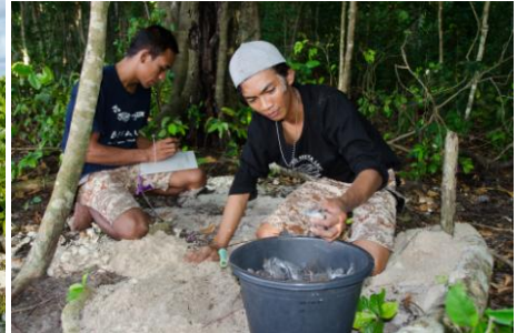
Zvláštní snůška vajec karety obrovské (vlevo).