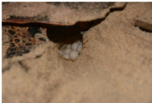
Kareta pravá (Erytmochelys imbricata), kriticky ohrožená vyhynutím, během února 2x kladla vejce na ostrově Mataha.

Mám vždycky ohromnou radost a cítím velké naplnění, když vidím, že jsme pomohli konkrétní želvě, že jsme do oceánu vypustili stovky mláďat, které by neměli šanci na život, pokud by na ostrovech zloději stále kladli vejce.